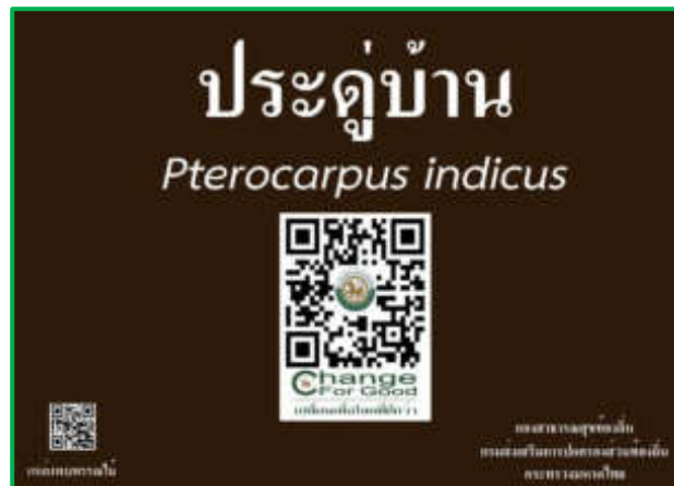
ภาพที่ 1 แสดงรูปแบบป้ายพรรณไม้ท้องถิ่น