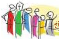
คู่มือประชาชน : พลเมืองคุณภาพ

ส่วนคำว่า พลเมืองคุณภาพ นั้น หมายถึง พลเมือง ที่สามารถทำหน้าที่ได้ตามคุณลักษณะความเป็นพลเมืองในระบอบประชาธิปไตย ได้แก่ การเคารพศักดิ์ศรีความเป็นมนุษย์ การเคารพสิทธิเสรีภาพ เคารพกฎหมายและกติกาสังคม การมีจิตสำนึกสาธารณะ รับผิดชอบต่อตนเอง ครอบครัว ชุมชน สังคม และประเทศชาติ รวมทั้งมีวิถีชีวิตแบบประชาธิปไตย และดำรงชีวิตตามหลักปรัชญาของเศรษฐกิจพอเพียง อีกด้วย