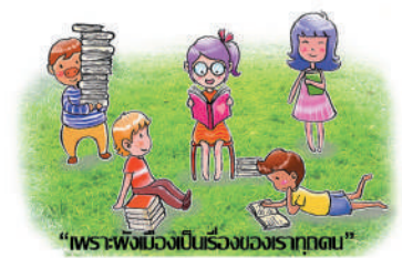
"เพราะผังเมืองเป็นเรื่องของรากหญ้า"