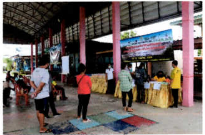
ภาพที่ ๑ ภาพการลงทะเบียนของผู้เข้าร่วมรับฟังความคิดเห็นของประชาชนในโครงการบริหารและจัดการขยะมูลฝอยชุมชนเป็นพลังงานไฟฟ้า