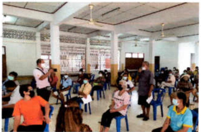
ภาพที่ ๔ ภาพการสอบถามของผู้เข้าร่วมรับฟังการชี้แจงโครงการบริหารและจัดการขยะมูลฝอยชุมชน เป็นพลังงานไฟฟ้า