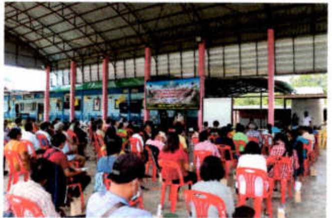
ภาพที่ ๓ ภาพบรรยากาศภายในงานขณะรับฟังการชี้แจงโครงการบริหารและจัดการขยะมูลฝอยชุมชน เป็นพลังงานไฟฟ้า