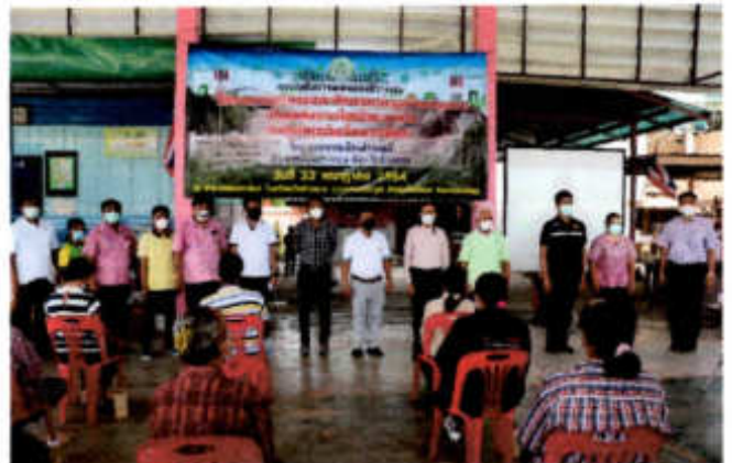
ภาพที่ ๒ ภาพการถ่ายภาพหมู่ของคณะผู้บริหารเทศบาลเมืองอ่างทอง ร่วมกับผู้นำชุมชน และตัวแทนจากหน่วยราชการที่เกี่ยวข้อง