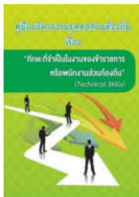
หนังสือ ทักษะที่จำเป็นในงานของข้าราชการ หรือพนักงานส่วนท้องถิ่น (Technical Skills)