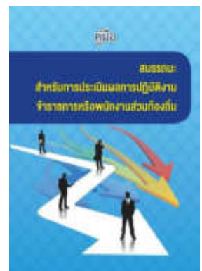
หนังสือ สมรรถนะสำหรับการประเมินผลการปฏิบัติงาน ข้าราชการหรือพนักงานส่วนท้องถิ่น