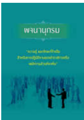
หนังสือ ความรู้ และทักษะที่จำเป็น สำหรับการปฏิบัติ งานของข้าราชการหรือพนักงานส่วนท้องถิ่น