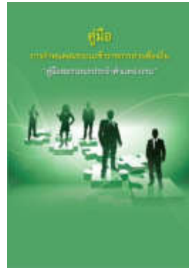
หนังสือ สมรรถะประจำตำแหน่งงาน