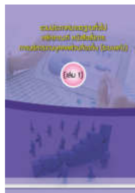
หนังสือ รวมประกาศมาตรฐานทั่วไป หลักเกณฑ์ หนังสือสั่งการ การบริหารงานบุคคลส่วนท้องถิ่น