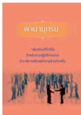
หนังสือ สมรรถนะที่จำเป็นสำหรับการปฏิบัติงานของ ข้าราชการหรือพนักงานส่วนท้องถิ่น