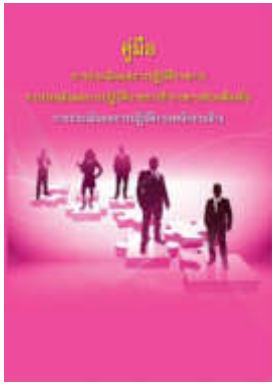
หนังสือ การประเมินผลการปฏิบัติงานพนักงานจ้าง