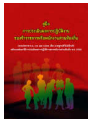
หนังสือ การประเมินผลการปฏิบัติงาน ของข้าราชการหรือพนักงานส่วนท้องถิ่น