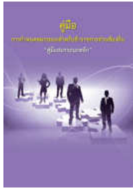
หนังสือ สมรรถะหลัก