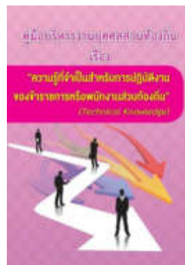
หนังสือ ความรู้ที่จำเป็นสำหรับการปฏิบัติงาน ของข้าราชการหรือพนักงานส่วนท้องถิ่น (Technical Knowledge I)